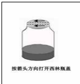
图 1 西林瓶开启图

注意: 如有特殊的接种方式、培养时间或培养方式, 请详见每种生化鉴定管附带的使用说明。